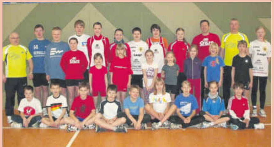
(Teilnehmer der 10. Laager Ferienfreizeit im Jahr 2011)